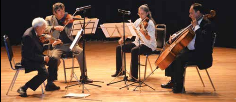
Cuarteto de Cuerdas.

La ENP cuenta con agrupaciones integradas por profesionales de la música