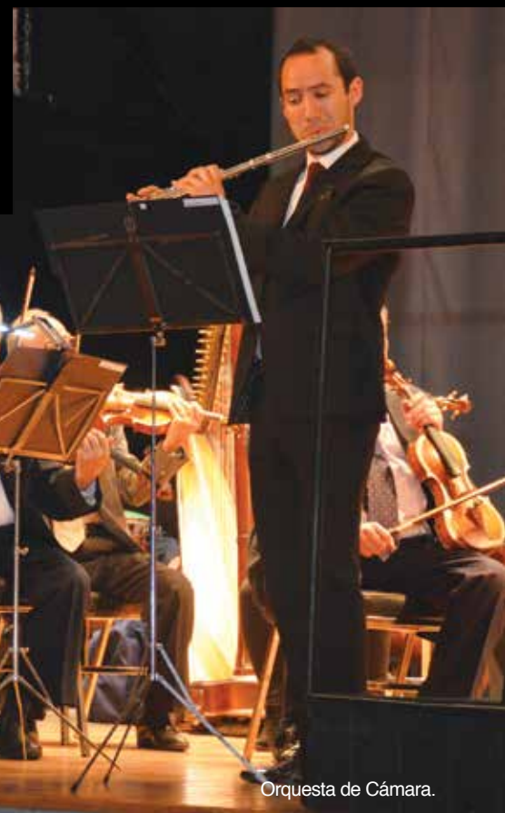
Orquesta de Cámara.

En el plantel 3 Justo Sierra, la comunidad se deleitó con el Allegro, Pensieri Adriaarmonici, Op. 1 , de Giacomo Facco; Cuartetos, Op. 41, Introdúzion-Andante espressivo , de Robert Schumann; y Cuarteto No. 3, Allegretto quasi moderato , de Charles Gounod.