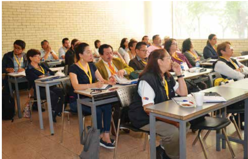
Tutores de la ENP durante las ponencias.