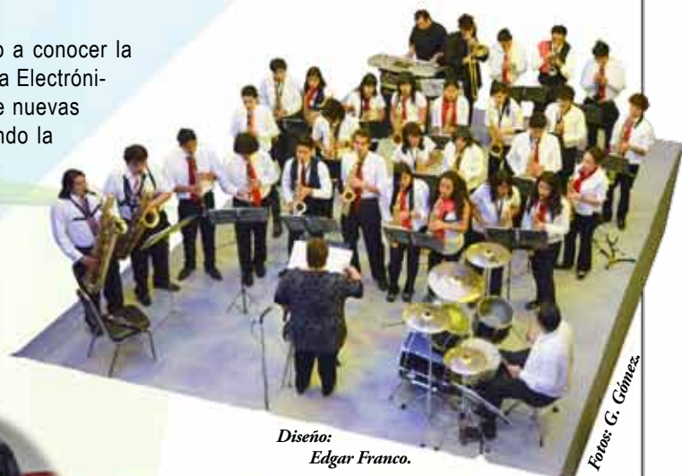
Diseño: Edgar Franco.