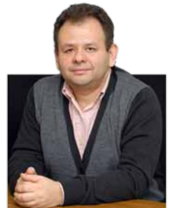
Luis Alberto Paredes Martínez Fotógrafo, Laboratorista y Prensa y Museógrafo Restaurador