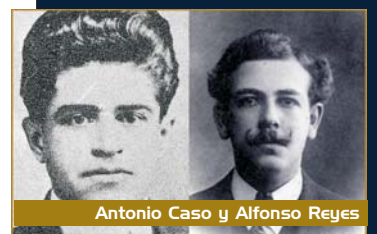
Antonio Caso y Alfonso Reyes