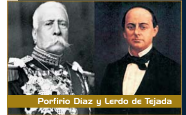
Porfirio Díaz y Lerdo de Tejada

El 27 de abril de ese mismo año, el Consejo Superior de Educación clausura sus sesiones informando que el "Proyecto Universitario" estaba concluido y se presentaría a la Cámara de Diputados.