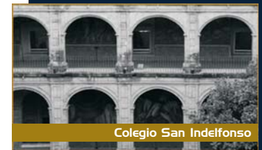
Colegio San Ildefonso