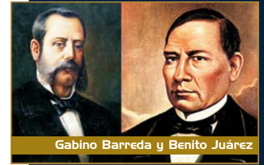
Gabino Barreda y Benito Juárez