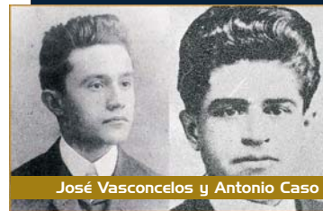
José Vasconcelos y Antonio Caso