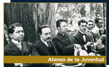
Ateneo de la Juventud