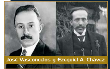
José Vasconcelos y Ezequiel A. Chávez